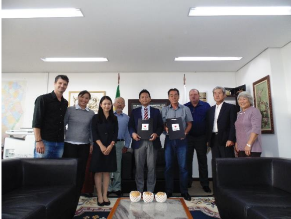
Cônsul-Geral Interino e convidados