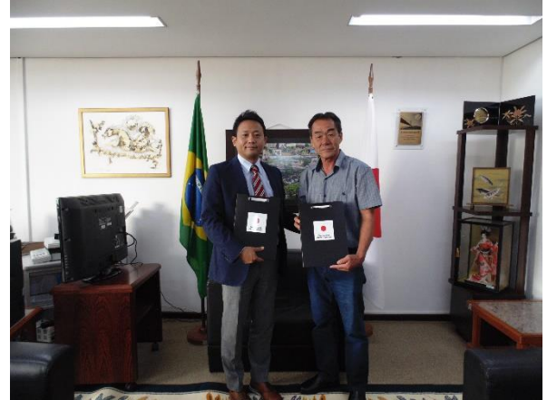
Cônsul-Geral Interino e Presidente da Associação