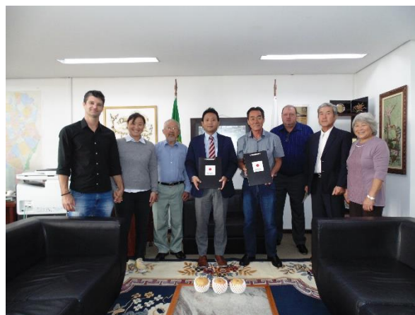
Cônsul-Geral Interino e convidados