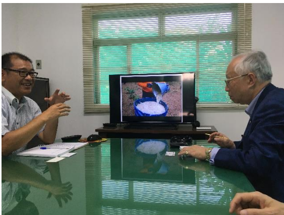
Troca de opiniões em Harima do Brasil

Durante estes encontros, foram debatidos temas sobre atuações de cada empresa e estratégias e planejamentos de negócios, fortalecendo os elos de cooperação e parceria bilaterais.