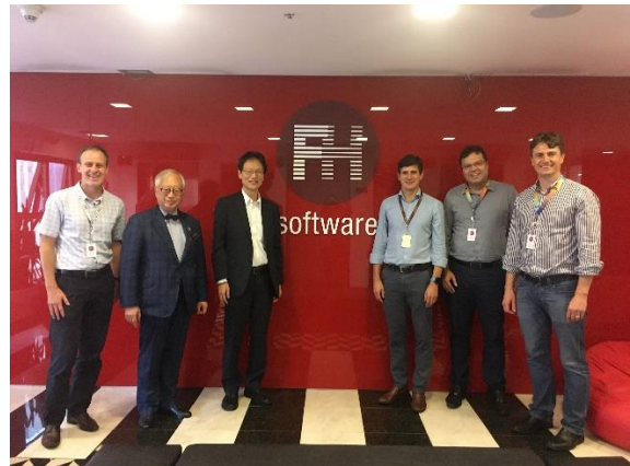
Visita de cortesia à NTT data

O Consulado Geral do Japão em Curitiba sempre atuante no apoio às empresas japonesas para fomento de negócios e auxílio às suas atividades de atuação, na Região Sul do Brasil.