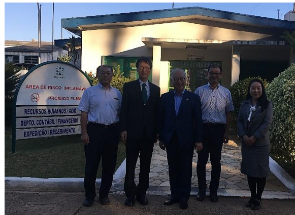
Visita à fábrica da Harima