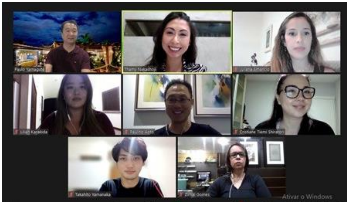
Espaço de networking interativo