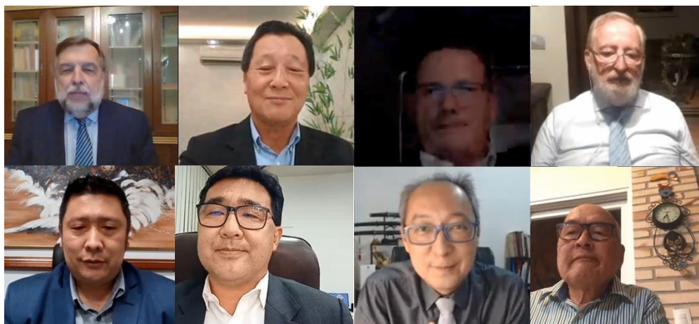
Pronunciamentos dos convidados