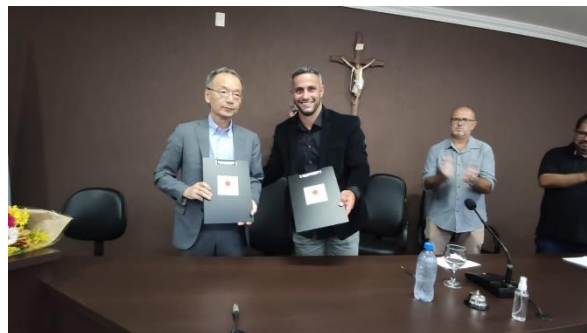
署名後の記念撮影