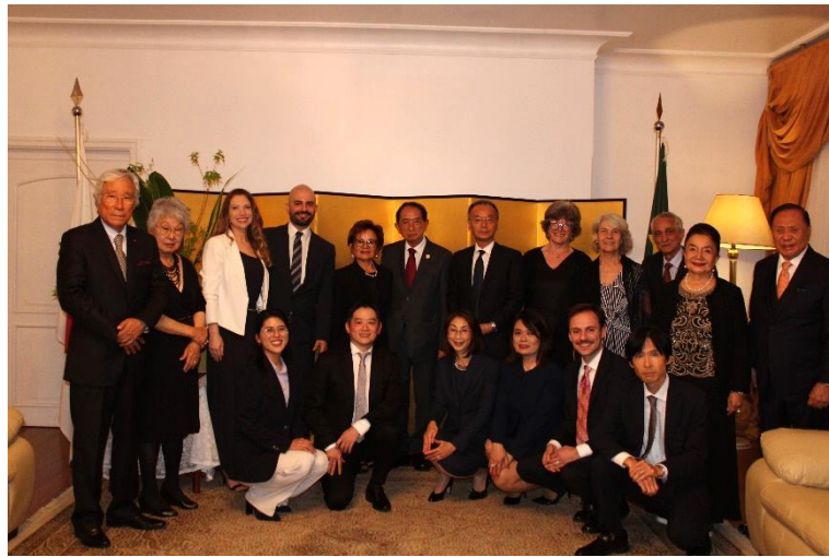
Com todos os convidados