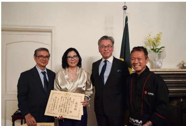
受章者3名と総領事

クリチバ日伯文化援護協会文化部長を長年務めつつ、同協会のカラオケ部で民謡指導も行い、同部のブラジル選抜歌謡大会出場にも貢献。日本人移住100周年を記念した当館総領事公邸でのレセプションや天皇誕生日祝賀レセプションにおいて、日本国歌の独唱を務めた実績を持つ。日本の民謡の普及や歌謡大会での活躍等を通じ、日系社会の活性化にも貢献。